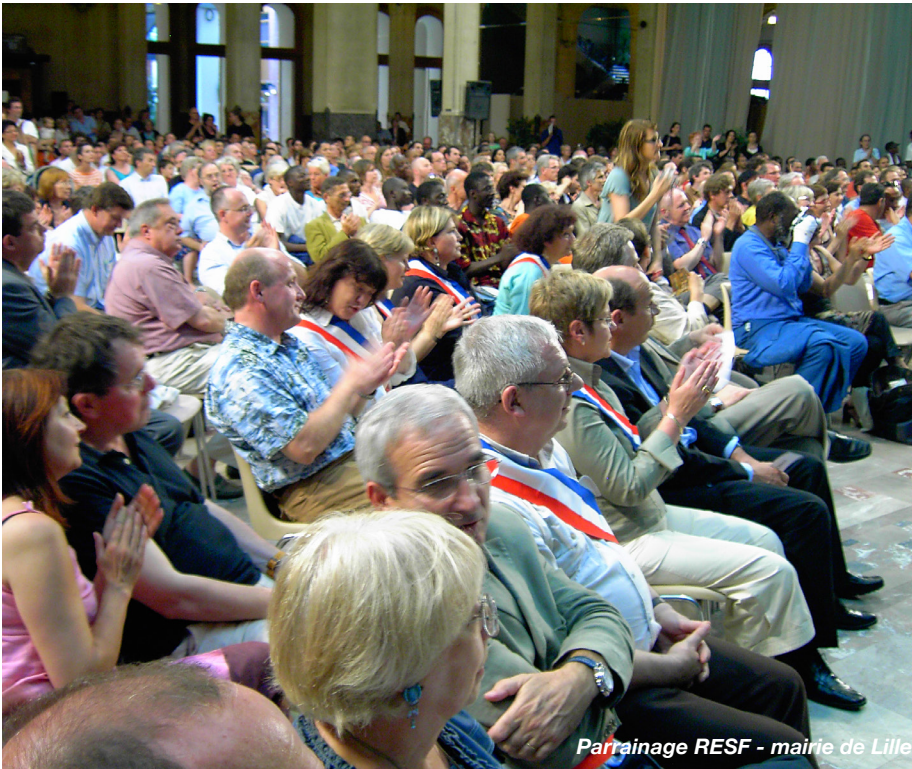
Parrainage RESF - mairie de Lille

Des mairies, des écoles, des collèges, des lycées affichent des banderoles revendiquant la régularisation de leurs élèves sans papiers et de leurs parent-es.